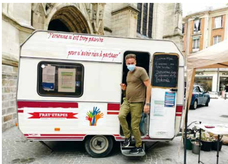
La caravane de la fraternité sillonne le diocèse, au service du vivre ensemble.

On joue ensemble, à la maison des familles, à Roubaix.