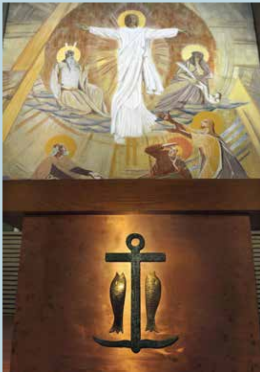
Autel de l'église Saint-Jacques à Neuilly-sur-Seine.

Mais pourquoi une ancre au cœur d'une église bien éloignée de tout rivage ? L'ancre était un signe de reconnaissance pour les premiers chrétiens. Parfois augmentée d'une barre transversale, et accompagnée de poissons évoquant les nouveaux convertis, elle rappelait la forme de la croix. En même temps, comme le dit la lettre aux Hébreux (6, 19-20), elle représente le solide ancrage de l'espérance chrétienne dans le Royaume du salut grâce à Jésus qui nous y précède. Celle que l'on voit ici s'inspire d'une ancre gravée dans la catacombe de Priscille à Rome au IIIe siècle, et manifeste ainsi la continuité de la foi au Christ.