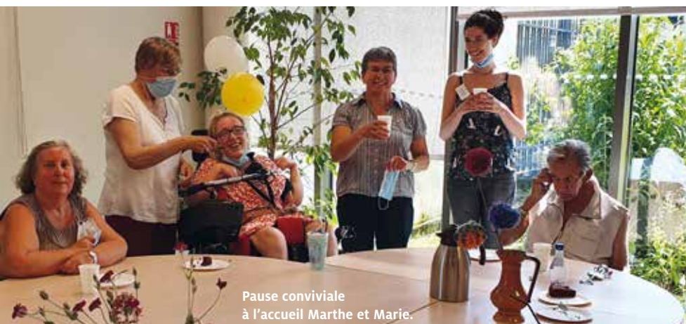
Pause conviviale à l'accueil Marthe et Marie.